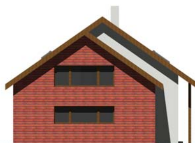
POHLED BOČNÍ (GARÁŽ)